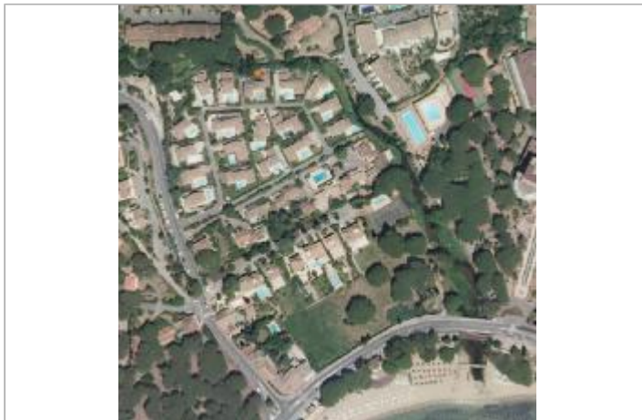
Vue du site - Orthophoto © IGN