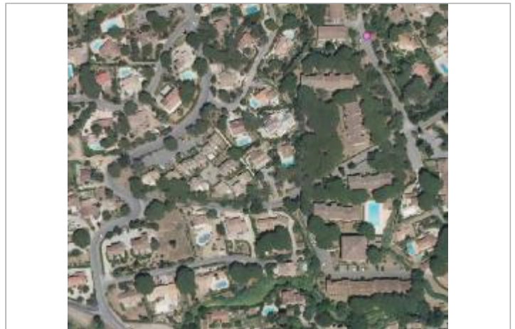
Vue du site - Orthophoto