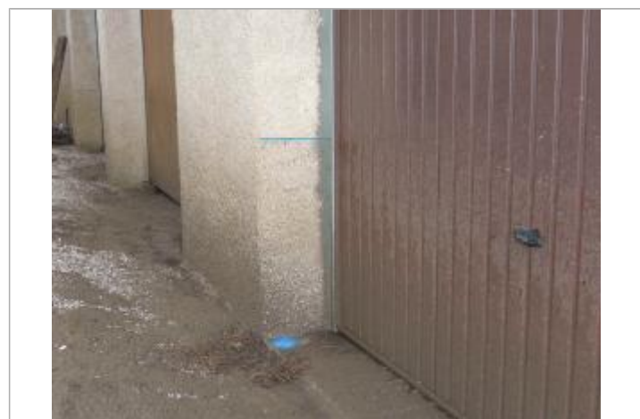
Vue du repère - Photo © CCGST

GÉNÉRAL Code : GAR2018_R_4_1 Date de mise à jour : 02/09/2021 Auteur : Cerema Méditerranée