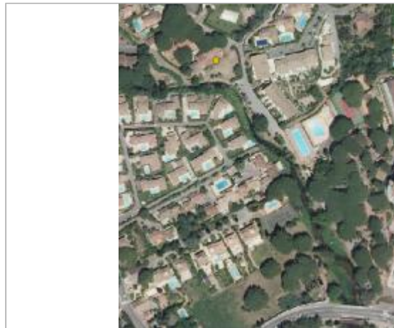
Vue du site - Orthophoto

Coordonnées WGS84 : X: 6.68086210 / Y: 43.34370650