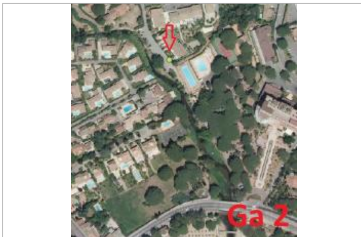
Vue du site - Ortophoto