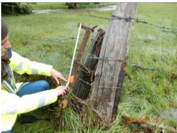
Laisse de débris de végétaux sur le grillage

Altitude calculée de l'eau (en m) : 157.809 m