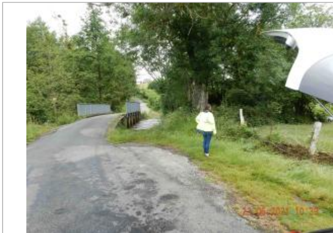
Route du Saussay poteau ciment de cloture agricole