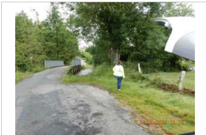
Route du Saussay poteau ciment de cloture agricole