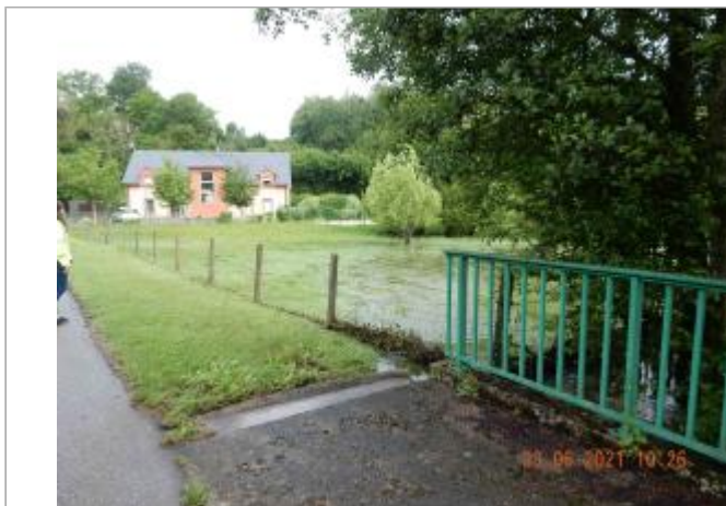
Grillage cloture Route de la Francardière