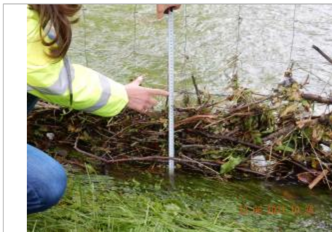
Laisse de crue sur grillage à 30 cm/sol

Maximum de l'inondation : Oui Visibilité : Oui État du repère : Bon Pérennité : Aucune