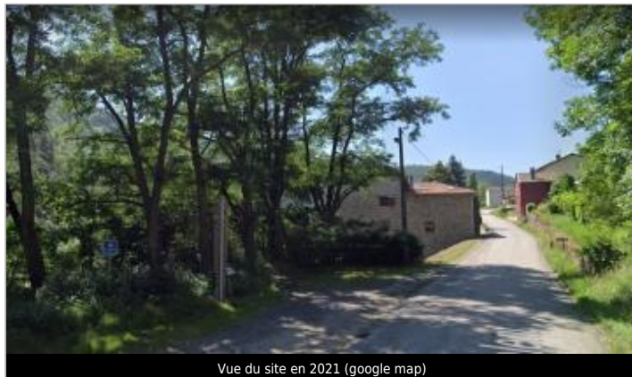
Vue du site en 2021 (google map)