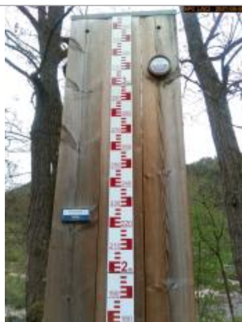
Vue du repère en 2021

Altitude calculée de l'eau (en m) : 473.205 m