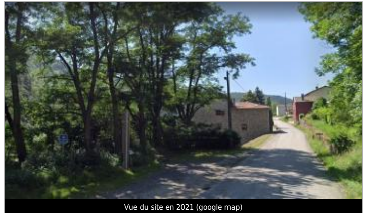
Vue du site en 2021 (google map)