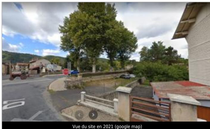
Vue du site en 2021