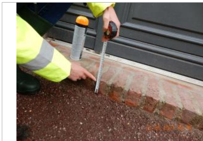
Laisse de crue au niveau du haut de la marche

Altitude calculée de l'eau (en m) : 138.249