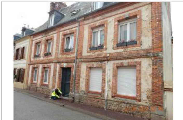
2 rue Bougy