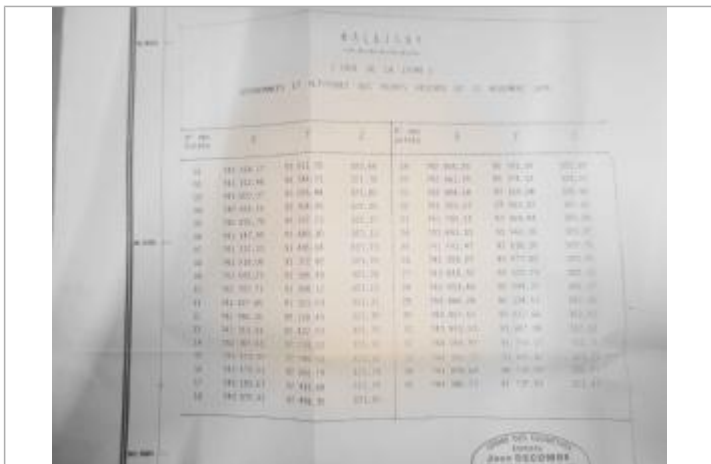
Photo du document écrit

Type de repérage : Source bibliographique Organisme(s) : Géomètre (cabinet)