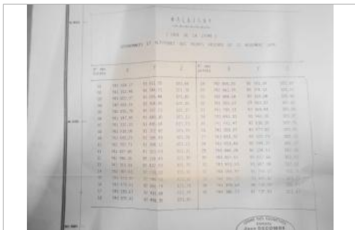
Photo du document écrit