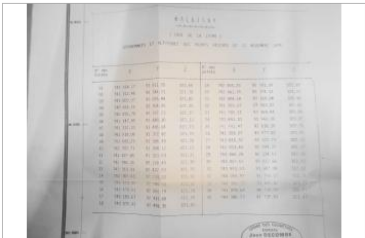
Photo du document écrit