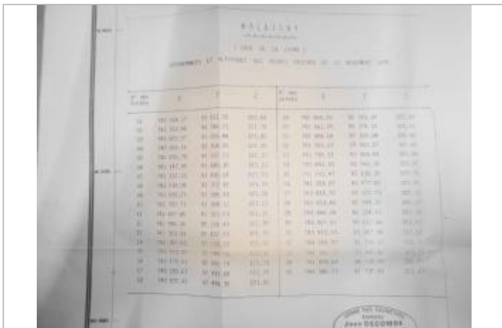
Photo du document écrit