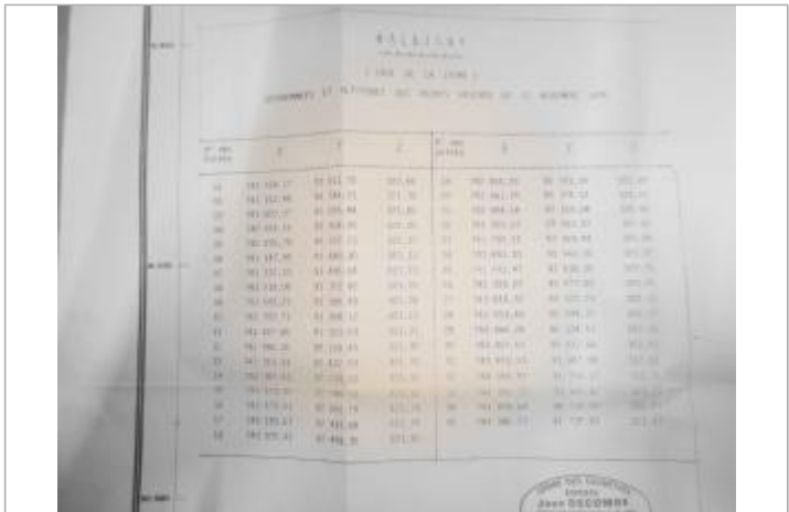
Photo du document écrit

GÉNÉRAL Code : WEB_R_202108264635 Date de mise à jour : 27/01/2026 Auteur : SPC LCI