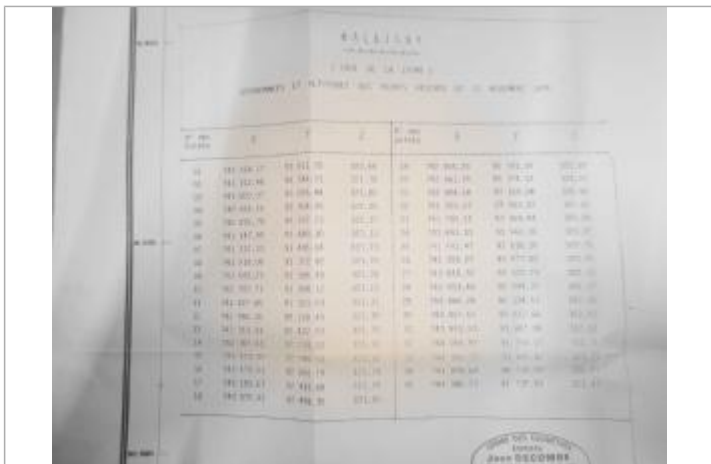
Photo du document écrit

Type de repérage : Source bibliographique Organisme(s) : Géomètre (cabinet)