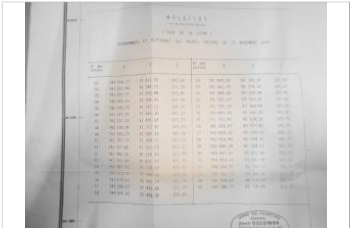
Photo du document écrit