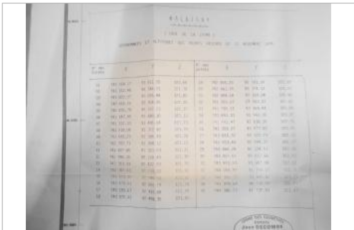
Photo du document écrit