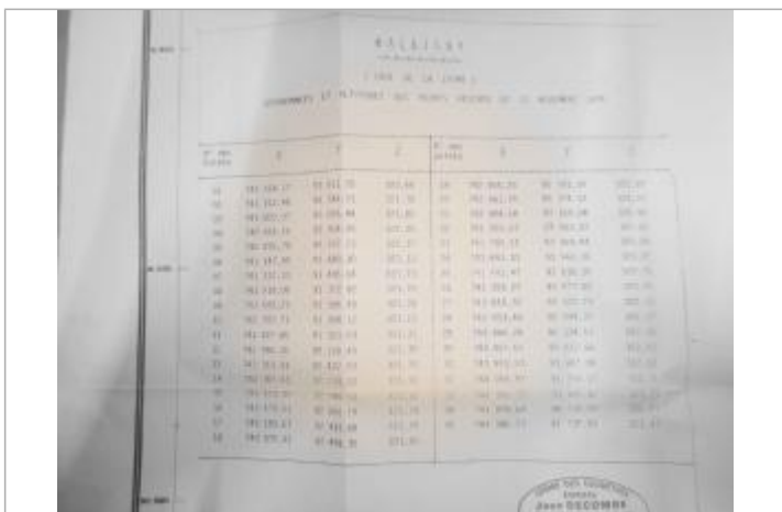
Photo du document écrit

Type de repérage : Source bibliographique Organisme(s) : Géomètre (cabinet)