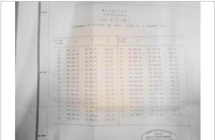
Photo du document écrit

GÉNÉRAL Code : WEB_R_202108262237 Date de mise à jour : 27/01/2026 Auteur : SPC LCI