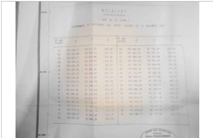
Photo du document écrit