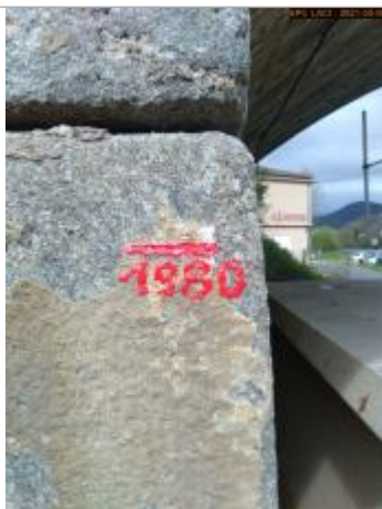
Vue du repère rapprochée en 2021

Altitude calculée de l'eau (en m) : 502.78