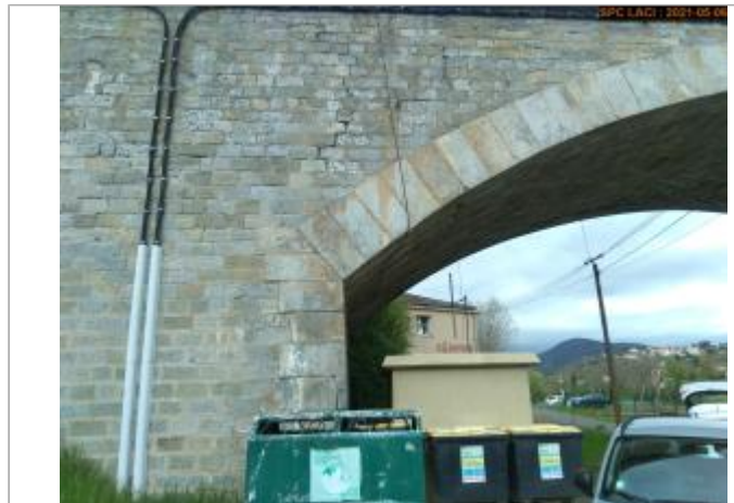
Vue du site en 2021

Coordonnées WGS84 : X: 4.03676380 / Y: 45.19868900