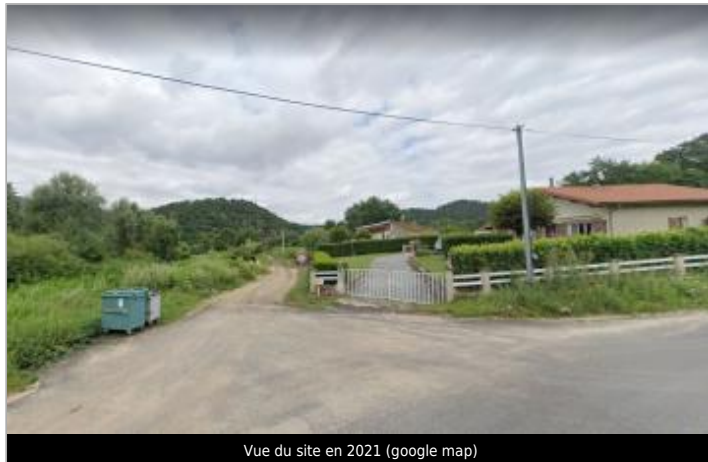
Vue du site en 2021 (google map)