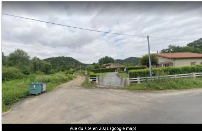
Vue du site en 2021 (google map)