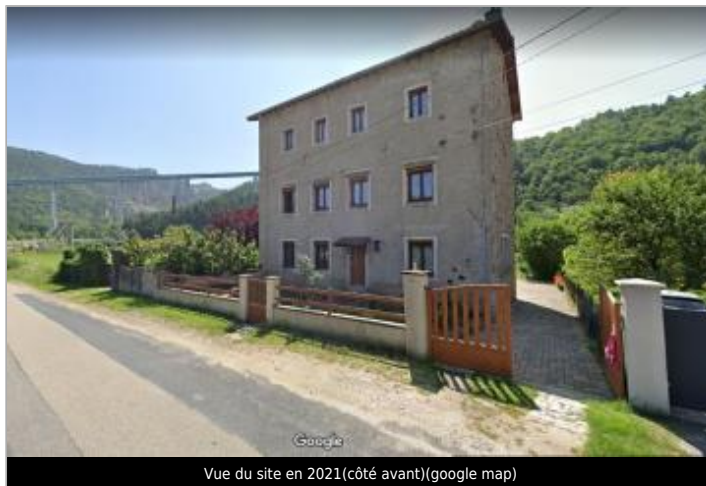
Vue du site en 2021(côté avant)