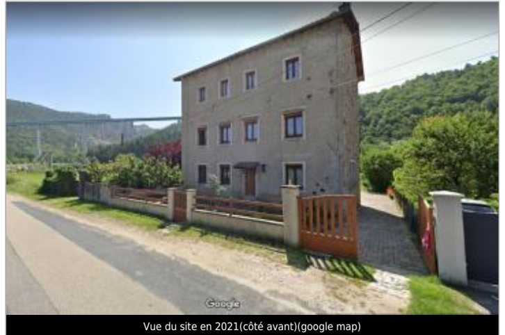
Vue du site en 2021(côté avant)(google map)

Coordonnées WGS84 : X: 4.14067000 / Y: 45.25802200