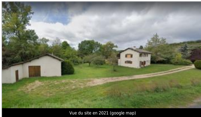
Vue du site en 2021 (google map)