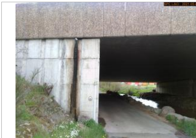
Vue du site en 2021