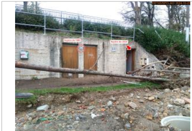
Vue du site et des repères de 1980 et de 2024, juste après la crue du 17 octobre 2024

Coordonnées WGS84 : X: 4.28586390 / Y: 45.11544400