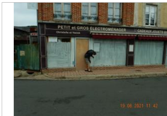
Laisse de crue sur façade quincaillerie à 51 cm/sol

Altitude calculée de l'eau (en m) : 229.285 m