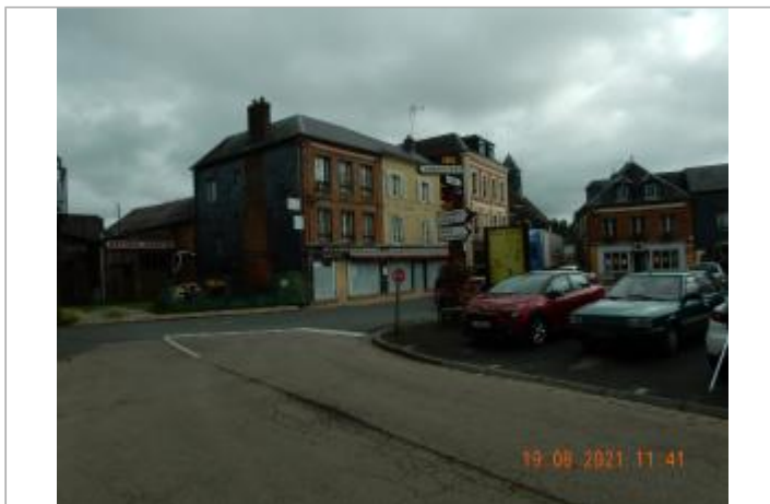
façade quincaillerie Place du Marché