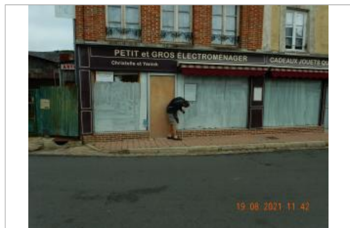
Laisse de crue sur façade quincaillerie à 51 cm/sol

MARQUE Maximum de l'inondation : Oui Visibilité : Non État du repère : Disparu Pérennité : Aucune