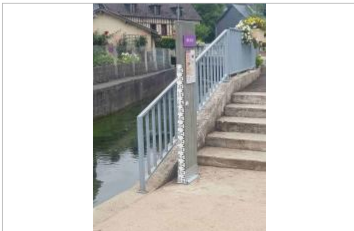
Repère de crue du Saffimbec à Pavilly