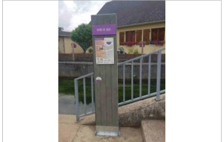
Repère de crue à Pavilly