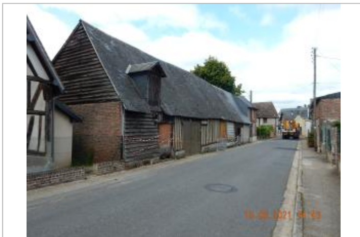
Porte de garage au 8 rue Hubert Laniel