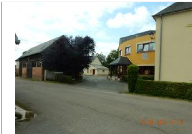
Sol devant maison de retraite