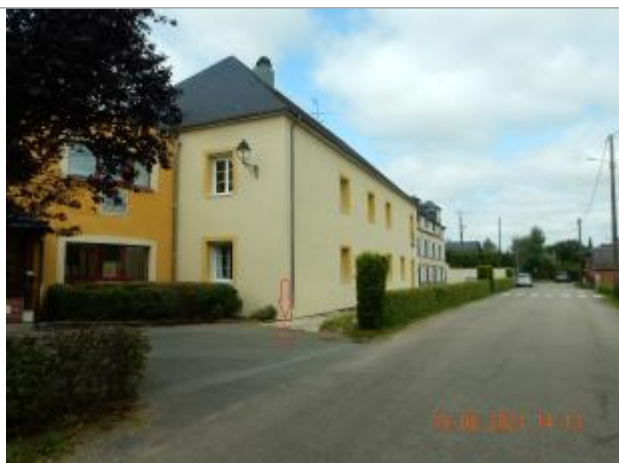
marque de peinture au sol devant maison de retraite

Altitude calculée de l'eau (en m) : 237.473