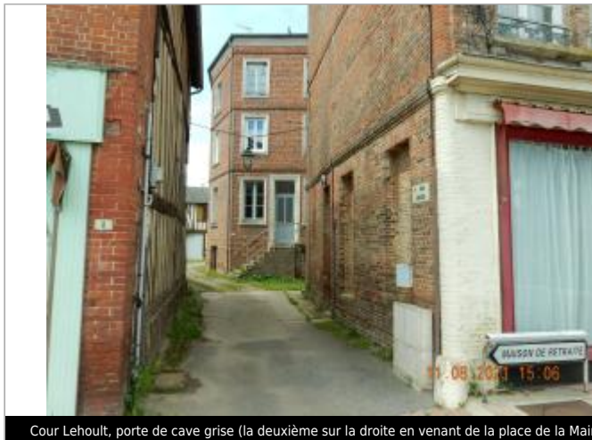
Cour Lehout, porte de cave grise (la deuxième sur la droite en venant de la place de la Mairie)