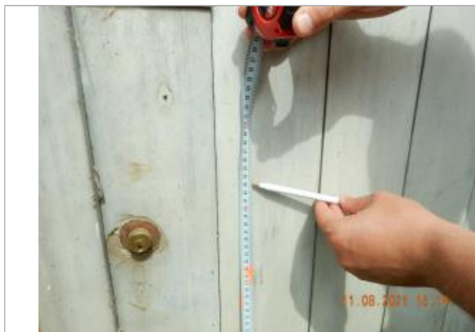
laisse de crue sur porte grise

Altitude calculée de l'eau (en m) : 229.323