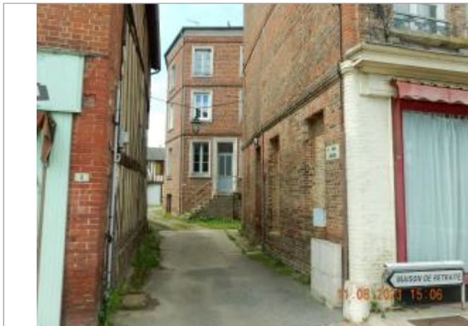
Cour Lehoult, porte sous petit porche