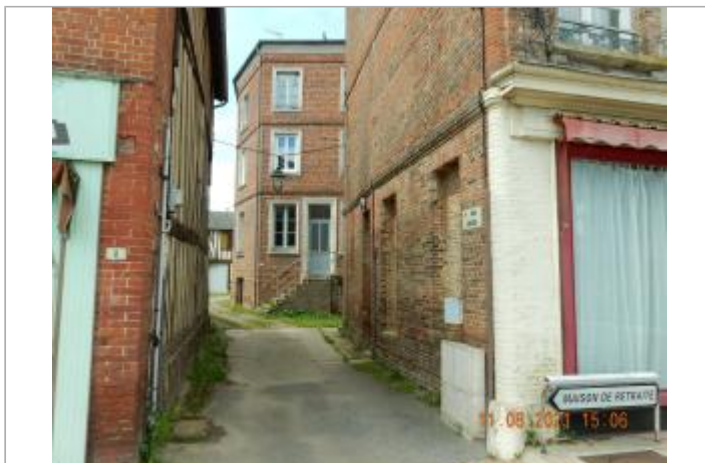
Cour Lehault, porte sous petit porche