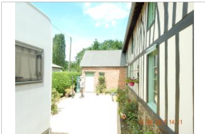
7 rue Homo, porte verte du cabanon en brique au fond de la cour