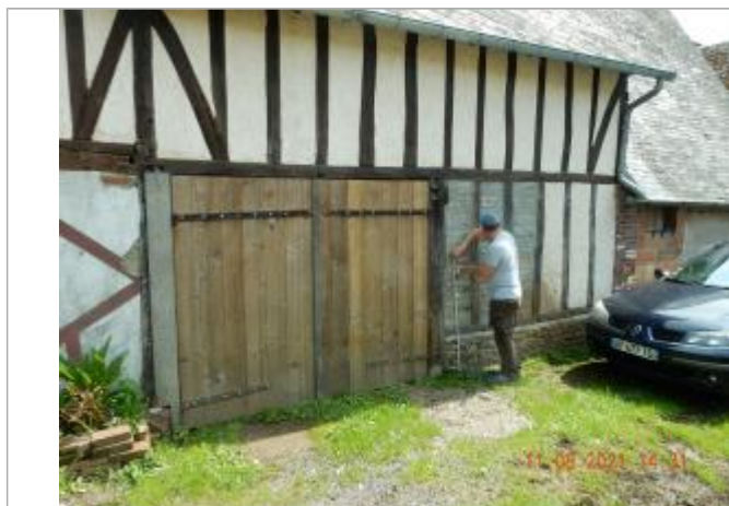
laisse de crue sur mur à 110cm/sol

Altitude calculée de l'eau (en m) : 229.063