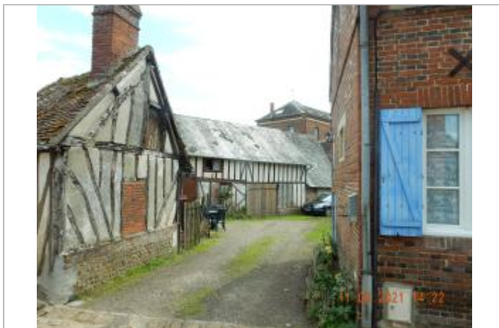
cour privative au 6 bis rue Homo