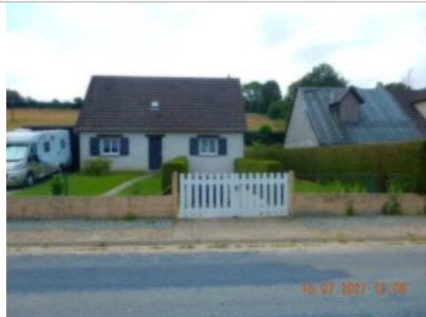
20 rue des bords du Cailly