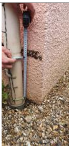
laisse de crue sur mur à 30 cm/sol

Organisme : SPC Seine aval - Côtiers normands