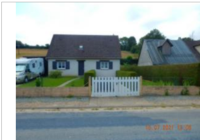
20 rue des bords du Cailly