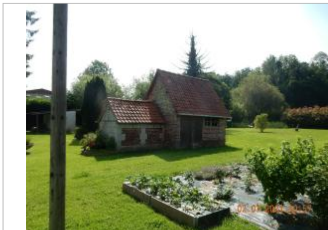
Cabane de jardin