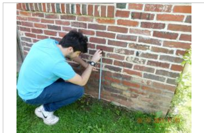
laisse de crue sur mur en brique