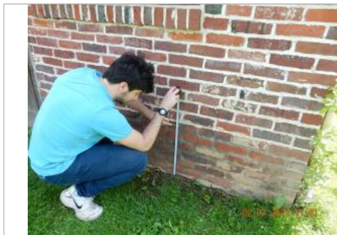
laisse de crue sur mur en brique

Altitude calculée de l'eau (en m) : 115.95 m