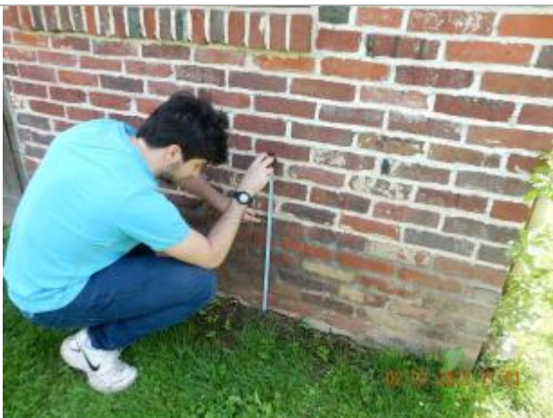
laisse de crue sur mur en brique

Altitude calculée de l'eau (en m) : 115.95