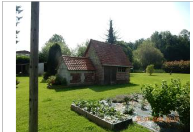
Cabane de jardin