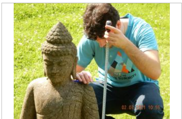
laisse de crue au niveau de la base du cou de la statue

MARQUE Maximum de l'inondation : Oui Visibilité : Non État du repère : Disparu Pérennité : Aucune