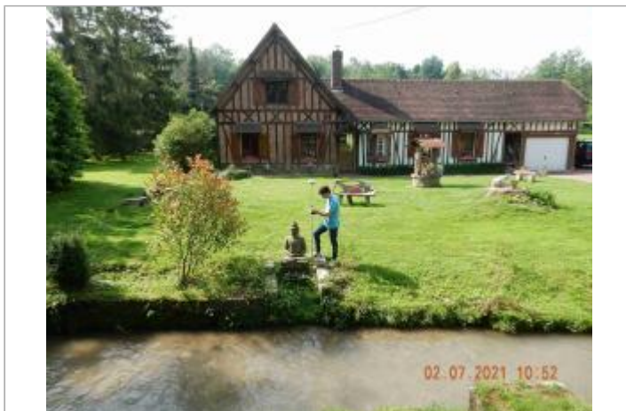
Statue devant maison sur la D44 à la sortie de Cailly