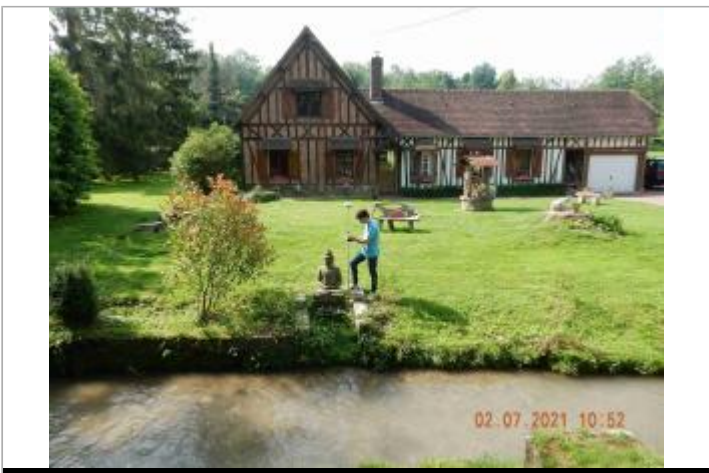
Statue devant maison sur la D44 à la sortie de Cailly

GÉOLOCALISATION Coordonnées WGS84 : X: 1.22329670 / Y: 49.57925200 Coordonnées RGF93 (Lambert 93) X: 571456.16 / Y: 6943670.19 Coordonnées RGF93 (ETRS89) : X: 1.2232967 / Y: 49.579252 Code Hydro: H5040600 Rive de référence: Gauche