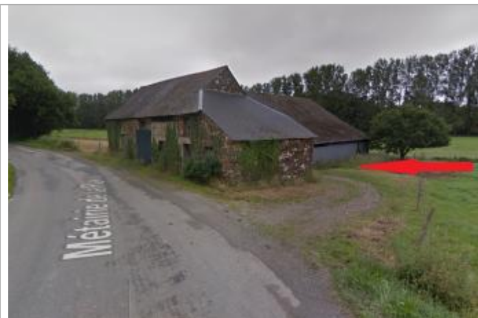
Bâtiment agricole de la métairie de La plaisse