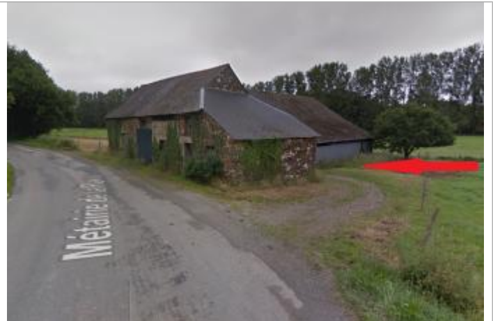
Bâtiment agricole de la métairie de La plaisse