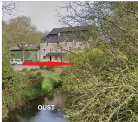
Moulin de Belle-isle à Hémonstoir

Coordonnées WGS84 : X: -2.82282440 / Y: 48.16244450