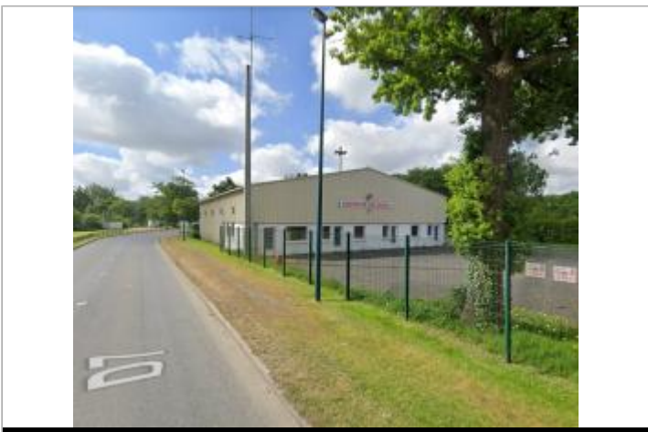
Local services techniques et pompiers

GÉOLOCALISATION Coordonnées WGS84 : X: -2.84523810 / Y: 48.19170890 Coordonnées RGF93 (Lambert 93) X: 266038.21 / Y: 6803997.58 Coordonnées RGF93 (ETRS89) : X: -2.8452381 / Y: 48.1917089 Code Hydro: J8--0230 Rive de référence: Droite