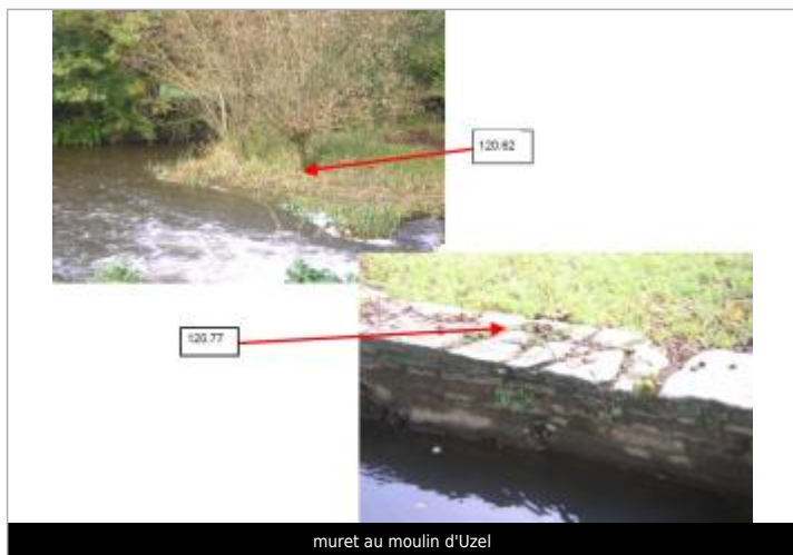
muret au moulin d'Uzel

Altitude calculée de l'eau (en m) : 120.77 m