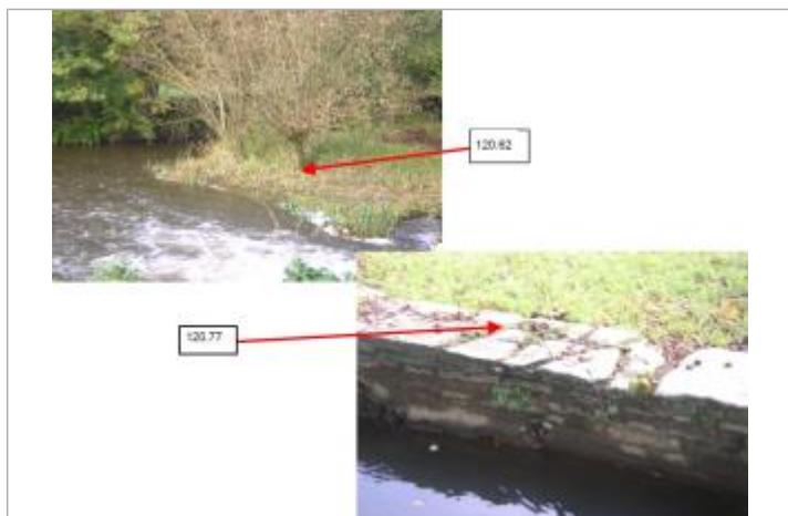
muret au moulin d'Uzel

SOURCE DE REPÉRAGE : CAMPAGNE AZI CÔTES D'ARMOR PAR BCEOM EN 2003 - 09/07/2003