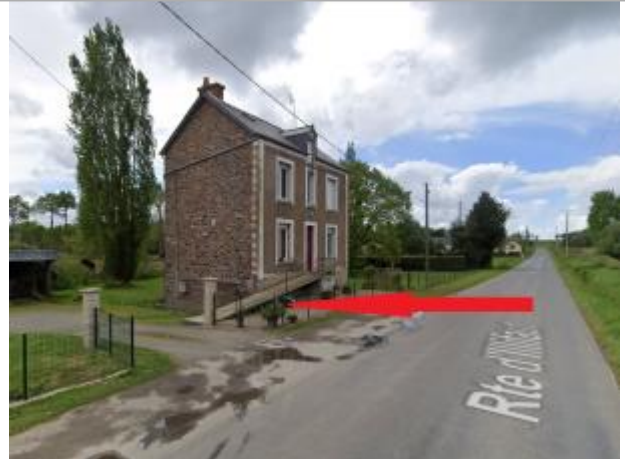
Accès sous-sol d'une maison d'habitation route d'Illifaut

Coordonnées WGS84 : X: -2.24522330 / Y: 48.17431490