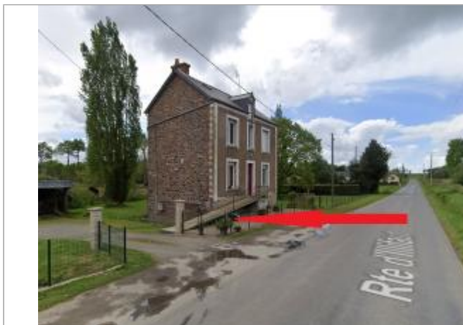
Accès sous-sol d'une maison d'habitation route d'Illifaut