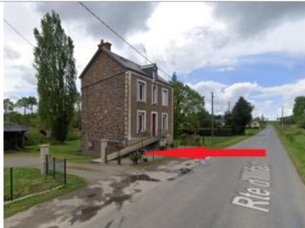
Accès sous-sol d'une maison d'habitation route d'Illifaut